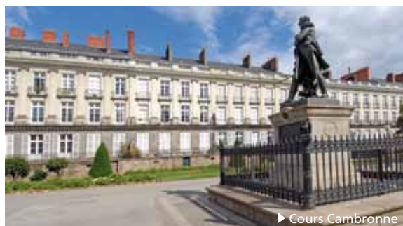
► Cours Cambronne