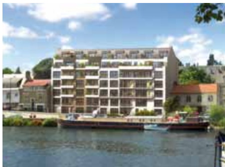
Le Madison - Nantes