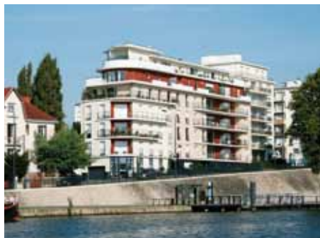
François 1 er - Nantes