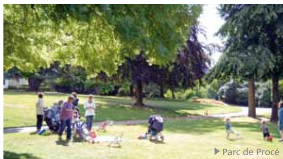
► Parc de Procé

Une incomparable qualité de vie, plébiscitée par diverses études, règne ici, rapidement accessible de Paris par TGV et à proximité du littoral atlantique.