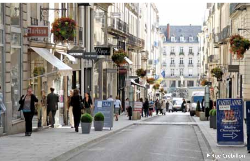
► Rue Crébillon