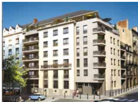
Pierre 1 er - Nantes